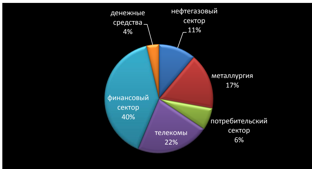
График 2. Состав активов Фонда, находящихся в доверительном управлении УК «Ренессанс Капитал» на конец отчетного периода